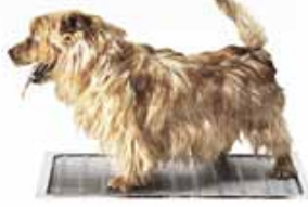
Kurasyöppö Mini 400 x 600 mm