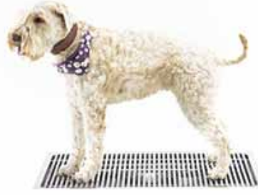
Kurasyöppö Midi 500 x 800 mm