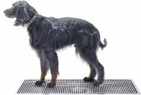
Kurasyöppö Maxi 600 x 1200 mm